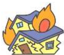
火災・破裂・爆発