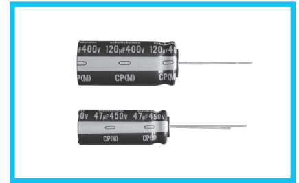
スリーブ色：ダークブラウン