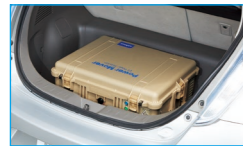
パワー・ムーバー®をクルマの荷室に載せて