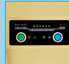
開始ボタンを押す ※写真は機能説明のために各ランプを点灯したものです。実際の状態を示すものではありません。