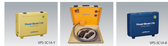
商品改良のため仕様・外観は予告なしに変更することがあります。

対応車両はいずれも電動自動車用充放電システムガイドラインV2L DC版に対応した車両に限ります。車両により使用に制限がある場合やソフトウェアのバージョンアップが必要になる場合があります。詳しくは自動車販売店にお問い合わせください。