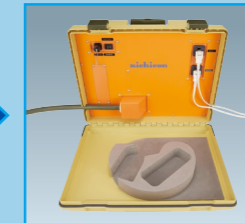
電気機器のプラグを本器のコンセントに挿し込む