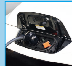
給電コネクタをクルマに接続